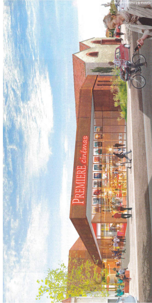
Projection Première Cinémas de Frontignan, vue de face, dans les anciens chais de la ville

Le GPCI exploite aujourd'hui le Parterre de Dourdan (deux salles), la DSP du Ciné Galaure de Saint-Vallier dans la Drôme (deux écrans) et le CinéMistral de Frontignan (mono-écran) en passe de concrétiser un projet de quatre salles. Enfin, à Vernon, le groupe s'est associé avec l'exploitant local des 4 Cinémas Théâtre et à Noé Cinémas, pour un complexe de huit salles à l'horizon 2022. À terme, le groupe exploitera ainsi un circuit de six cinémas.